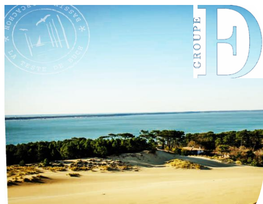
La Dune du Pilat, la plus haute d'Europe, un monument naturel trésor de la région.